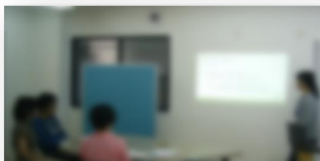
セミナー 様子・感想